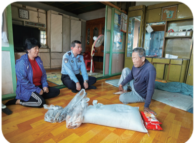
近日，龙井市开山屯边境派出所开展慰问辖区困难群众活动。