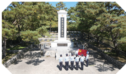
日前，白山边境管理支队金华边境派出所、十三道沟边境派出所、十四道沟边境派出所党支部联合开展主题活动。

卖产品安全可靠、可追溯，进一步促进了农产品的销售。工作人员现场为群众讲解国家禁限用农药的种类、规范使用农药和农药器械、简易消除瓜果蔬菜农药残留等关乎农产品质量安全的常识，引导群众增强农产品质量安全意识和安全生产意识。