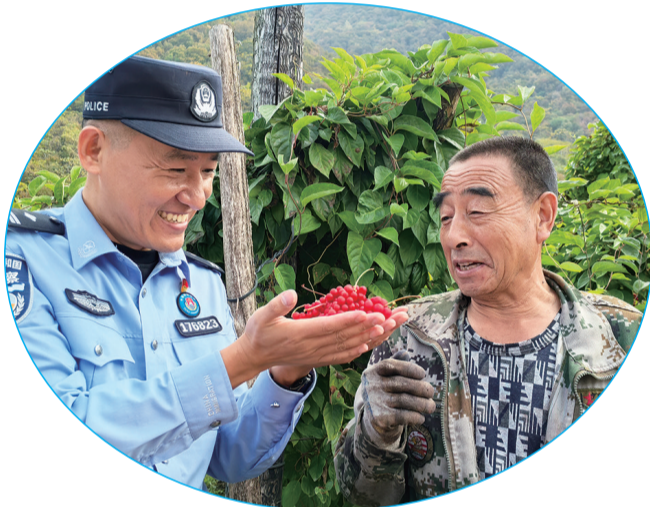
近日，白山市浑江区三道沟镇五味子丰收，三道沟边境派出所民警深入田间地头，帮助农民采摘。王宇 时铭艺 记者 郭小宇/摄

“我们希望通过这次入选省级传统村落名录，能够进一步挖掘和保护我们的文化遗产。同时，也吸引更多游客前来体验乡村风情，品尝地道的洮儿河大酱，感受当地人的热情和友善，邂逅新平村独特的田园风光。”新平村党支部书记满怀期待地说。