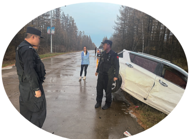
延边边境管理支队双峰边境检查站加强巡逻工作，及时救助辖区一台遇险车辆，受到群众称赞。